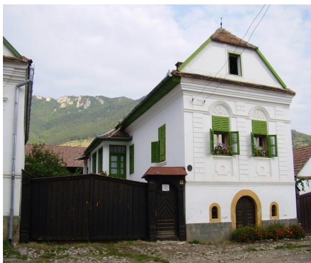
8. kép: Ház Torockón