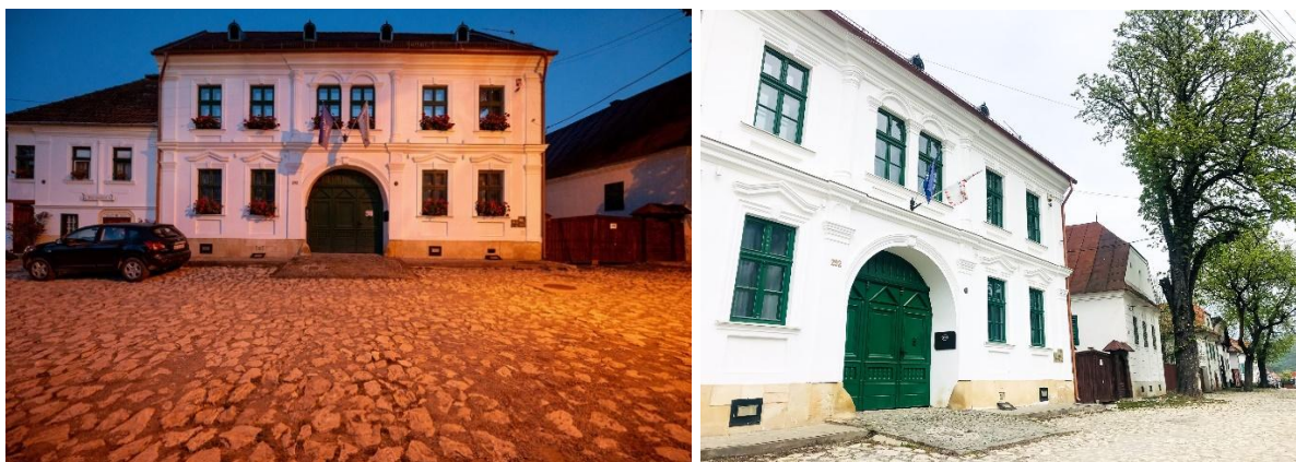
20–21. kép: Duna Ház

A Duna Televízió 2014-ben nyitotta meg Torockón kulturális központját, a Duna Házat , amely – és ebben minden interjúalany egyetértett, hogy – a megalakulásától kezdve meghatározó szerepet tölt be Torockó kulturális életében. Az interjúalanyok kiemelték, hogy az örökségátadást leginkább a Duna Háznak a programjai, a Duna Ház beavatkozásai segítik, melyek éltetik a hagyományokat (20–21. kép).