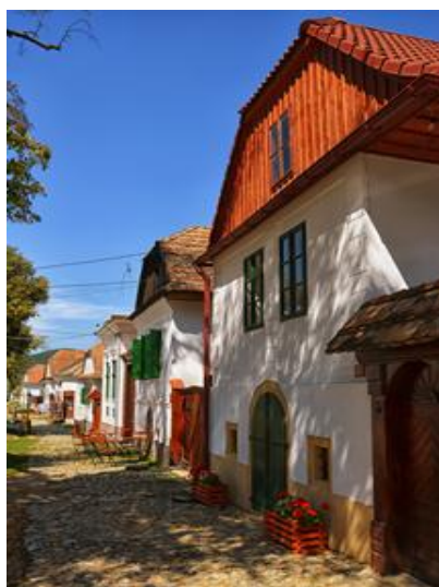
7. kép: Alsó piacsor házai