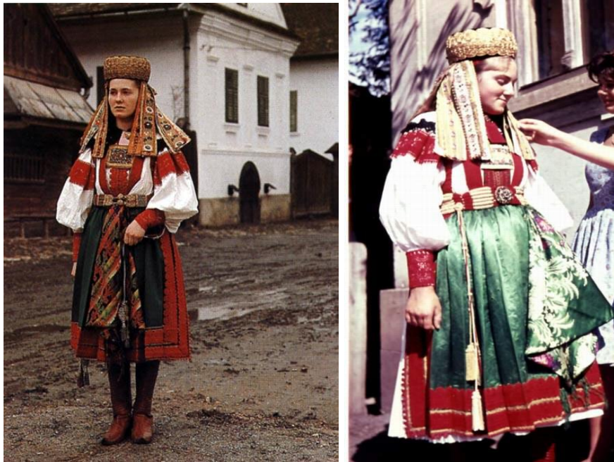
10–11. kép: Torockói női viselet