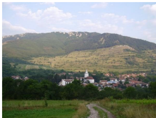
1. kép: Torockó látképe

Torockó (románul Rimetea, korábban Trascău, németül Eisenburg) magyar szórványtelepülés Romániában, Fehér megyében. Egykori bányászváros, a Székelykő hármass csúcsa alatt, lakói ide betelepült székelyek. A település Erdély legnyugatibb székely végvára. A Torockói-hegységben, a Székelykő és az Ordaskő sziklavonulatának völgyében, Kolozsvártól délre, Nagyenyedtől 23 km-re északnyugatra fekszik, közigazgatásilag egy községet alkot Torockószentgyörgy településsel. A község (Torockó és Torockószentgyörgy) lakóinak száma 1015 fő. Torockó lakóinak száma körülbelül 500 fő, melynek 90%-a magyar nemzetiségű. 2 (1–2. kép)