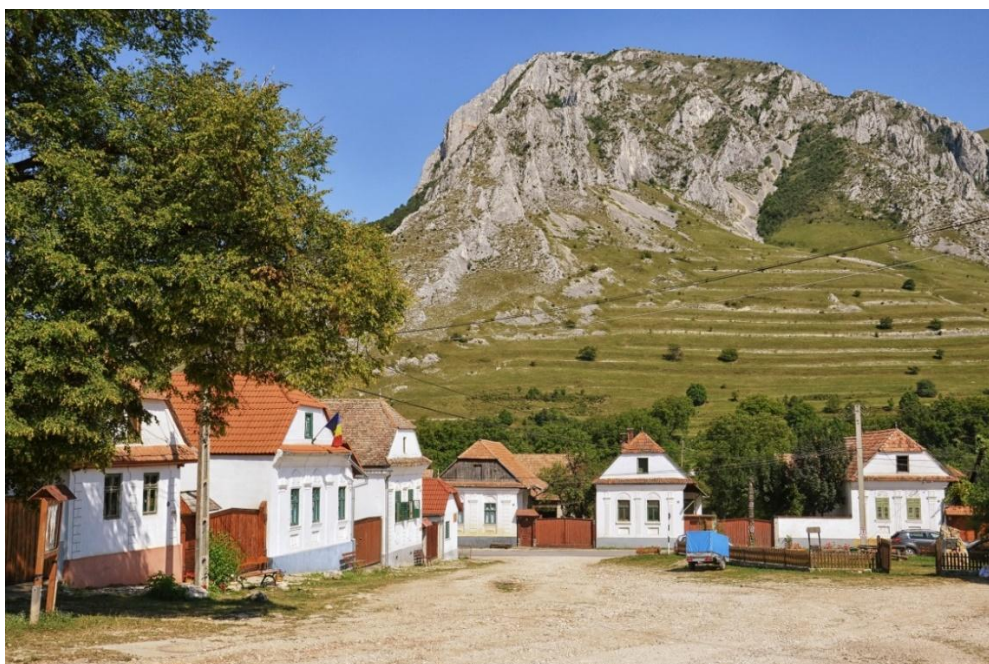
5. kép: A főtér házai a Székelykövel

Ahhoz, hogy Torockó az ezredfordulóra az erdélyi magyar népi építészet egyik legértékesebb megmaradt örökségévé váljon, furcsa módon a település életének két sajnálatos eseménye járult hozzá: az 1870-es tűzvész és 1880 után a vasbányászat megszűnése. Máig sem tisztázott, hogy a tűz gyújtogatás vagy a véletlen műve volt. Az a tény, hogy a Piactér házai égtek le, ahol a legtehetősebb torockóiak laktak, gyújtogatásra utal. Az is biztos, hogy a hajdani, főleg fából épült, kémény nélküli házak hamar kigyulladtak. Akkori feljegyzések szerint 40 ház égett le. Természetes, hogy mindenki anyagi lehetőségeihez mérten a lehető leghamarabb szeretne volna újraépíteni otthonát, de látva a tűz pusztítását, féltek a fától mint építőanyagtól, és házaik falát kőből rakták. Egyforma lett a házak magassága, és nagyjából a formája is. Egyik építető sem akart lemaradni a szomszédától, de hivalkodni sem szeretett volna egy egészen más méretű vagy formájú épülettel. 19 (5. kép)