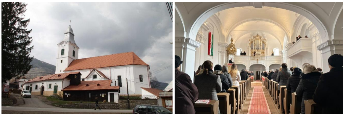
16–17. kép: Torockói unitárius templom