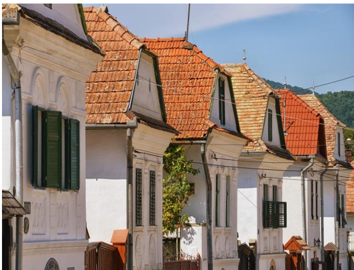
6. kép: A Felső piacsor házai