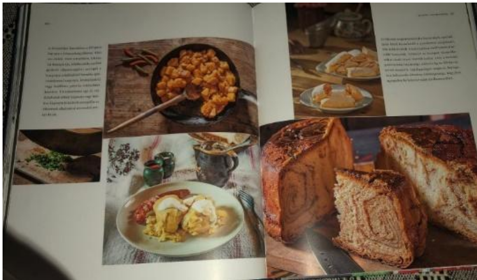
22. kép: Torockói ételek

három vendéglátóhelyén, több szállasadónál, valamint a rendezvények alkalmával is meg lehet kóstolni a jellegzetes torockói ételeket (22. kép).