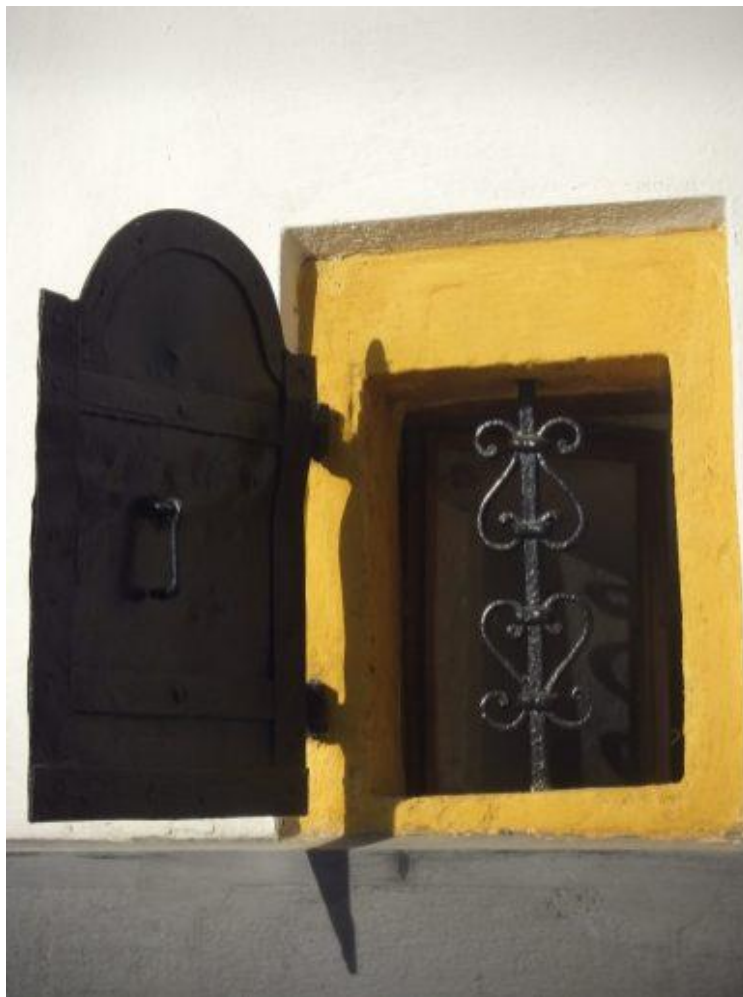
4. kép: Kovácsolt ablakrács