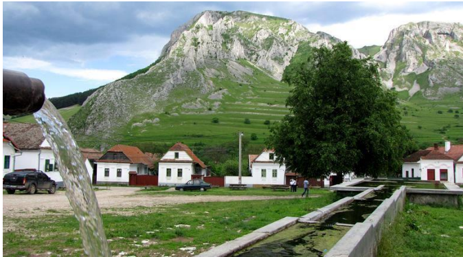
18. kép: Vajor a Templom téren