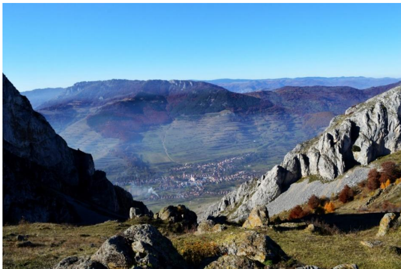
3. kép: Székelykő és Torockó

A falu mellett 1130 méter magasra tornyosul Erdély egyik legjellegzetesebb sziklatömbje, a néphit szerint emberalakot megmintázó Székelykő. 10 Torockóval kapcsolatban ismeretes egy mondás, mely szerint itt „a Nap kétszer kel fel”. Korán reggel megjelenik az égbolton, a Székelykőtől balra, majd elbújik a Székelykő mögé, és csak később emelkedik olyan magasra, hogy bevilágíthassa az egész falut. Ezt a különös jelenséget az 1130 méteres észak-dél vonulatú Székelykő sajátos alakja okozza. Reggel a Nap a Székelykő Kiskőnek nevezett oldala mögül kel fel, de hamarosan el is bújik, a falut a hegy árnyéka takarja. A második, „igazi” napkelte akkor van, amikor a nap látszólagos útján már a Nagyarok felett jár. A jelenség az Alsó Piacsor és a Kővár utca házainak udvarán figyelhető meg a legjobban. 11 (3. kép)