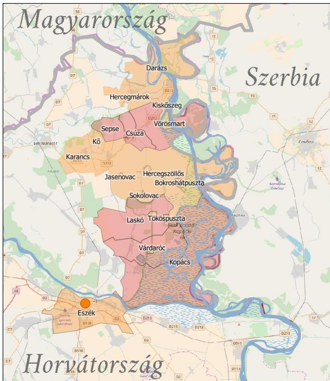
3. ábra: A tömb településeinek földrajzi elhelyezkedése

A tárgyalt tömb a többi tömbtől eltérően község szinten került lehatárolásra. A három tömbalkotó közigazgatási körzet Darázs, Belye és Hercegszöllős körzete. Központi, illetve magyar többségű körzet nem képezi részét a tömbnek, így mindhárom körzet puffernek minősül.